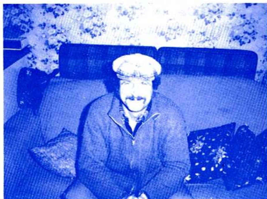
table. Et puis, il faut bien reconnaître que si les propriétaires faisaient un peu d'entretien autour de leurs terrains cela permettrait d'aller beaucoup plus vite. D'ailleurs dans certains quartiers, mon rôle est très facile du fait du travail d'entretien effectué par les riverains.